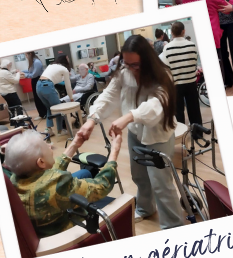
Année en gériatrie