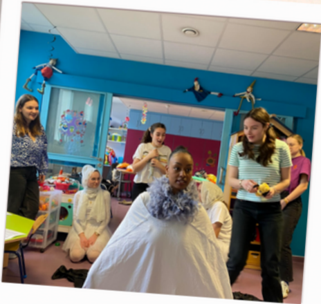
Théâtre en pédiatrie