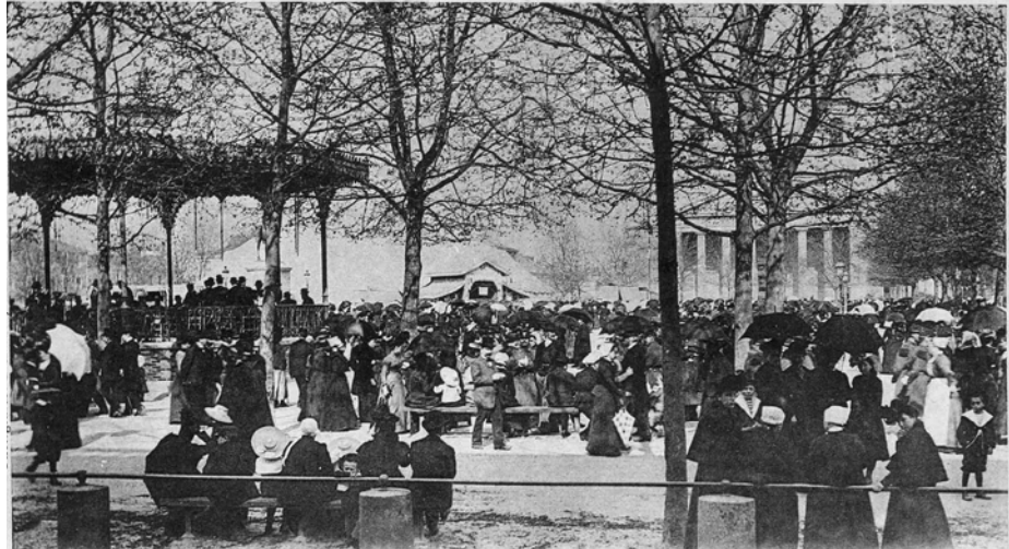
LA ROCHE-SUR-YON. — La Musique, Place d'Armes

Est-ce que morte, mais moi vite le plus inerte 31/10